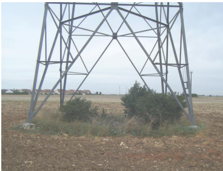
Végétation compatible avec les obligations de RTE

A l'intérieur des pylônes, la hauteur de la végétation ne doit pas dépasser 2 mètres. De plus, dans un rayon d'1 mètre autour de chaque pied de pylônes, aucune végétation ne devra dépasser la hauteur de la cheminée en béton.