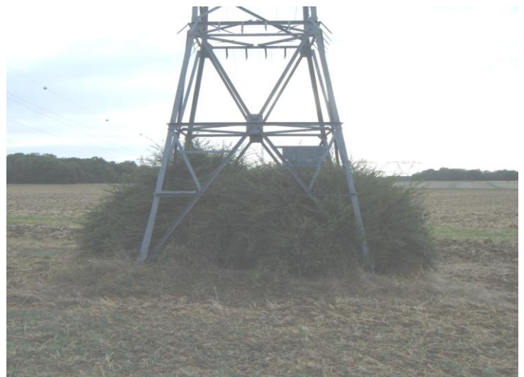
Végétation incompatible avec les obligations de RTE