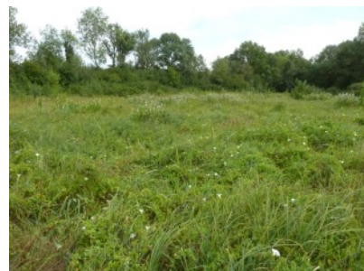
Habitat où a été observé le Cuivré des marais en 2019 sur la ZSC

Les prairies humides constituent l' habitat privilégié du Cuivré des marais, rhopalocère protégé à l'échelle nationale et européenne. Ce papillon est en danger d'extinction en Ile-de-France, où il y est très rare . On le retrouve dans la Bassée Seine-et-Marnaise et Aubeoise, ainsi que dans les vallées du Petit et du Grand Morin. Inscrit à l'annexe II de la directive « Habitats-Faune-Flore » de 1992, il est une espèce dite « d'intérêt communautaire », et fait donc l'objet d'un suivi particulier sur la ZSC « La Bassée ».