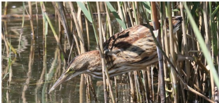
Butor étoilé à l'affût dans la roselière

Il fait partie, à ce titre, des espèces que nous suivons en priorité dans la ZPS « Bassée et plaines adjacentes ». C'est un oiseau nicheur rare en France.